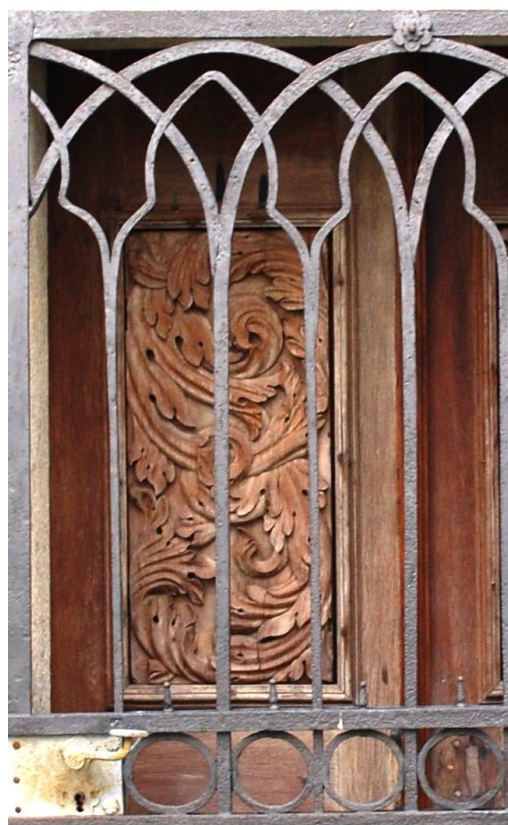
Detail 110210 hl 052