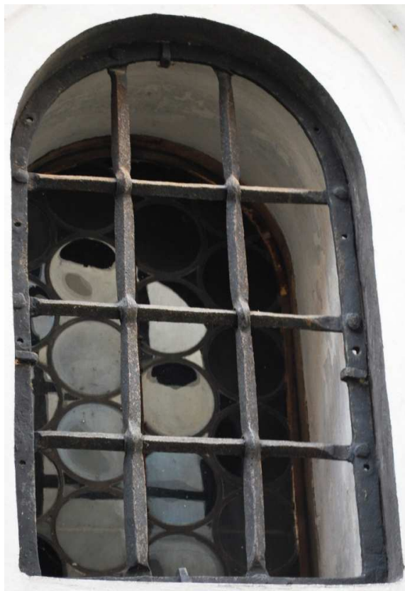
Pohled z exteriéru 110210 hl 070