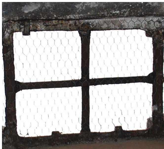
Pohled z interiéru 110216 hl 118