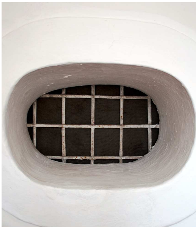
Pohled ze schodiště 1.16 110127 hl 181