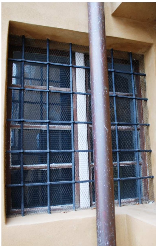
Pohled z exteriéru 110127 hl 338