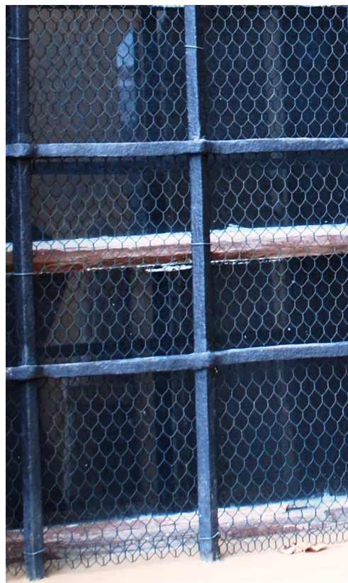
Detail 110127 hl 338