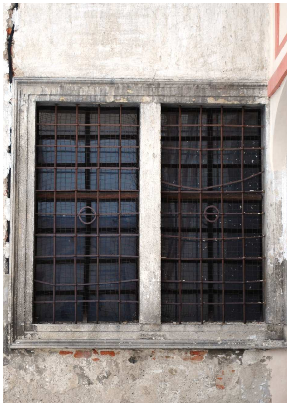
Pohled z nádvoří 110127 hl 331