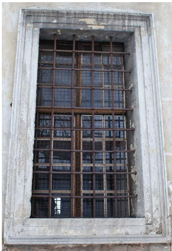
Pohled z nádvoří – M/1.1 110127 hl 329