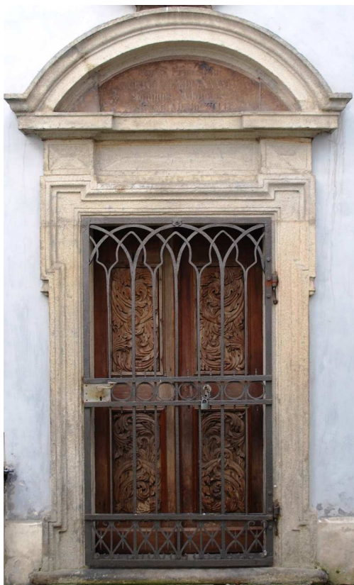
Pohled od ambíků 110210 hl 052