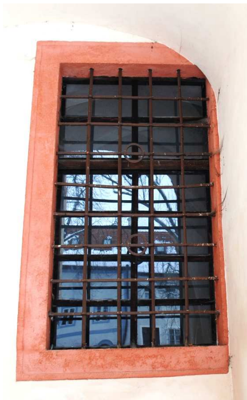
Pohled z nádvoří 110127 hl 330