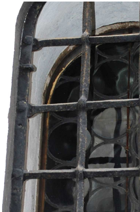
Pohled z interiéru 110210 hl 076