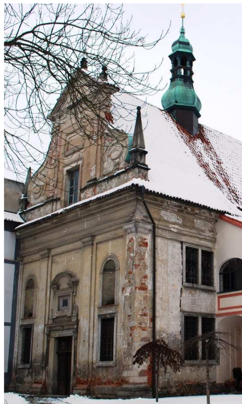
Celkový pohled na západní část jižního průčelí 110127 hl 323