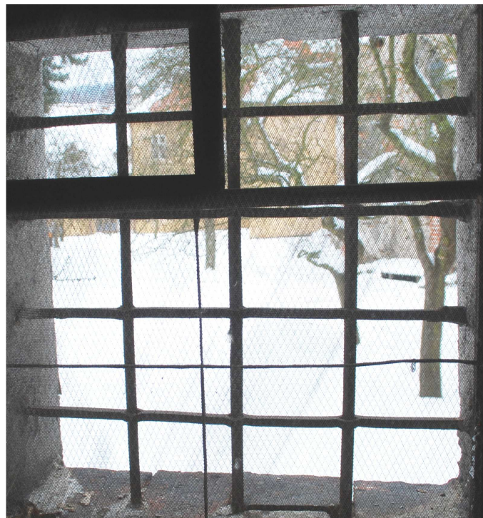
Pohled z interiéru 110127 hl 274