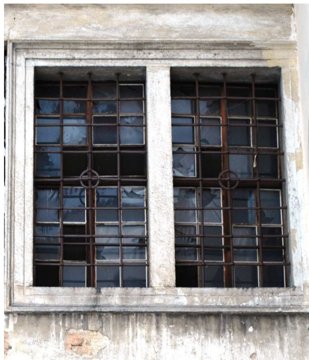
Pohled z nádvoří 110127 hl 332