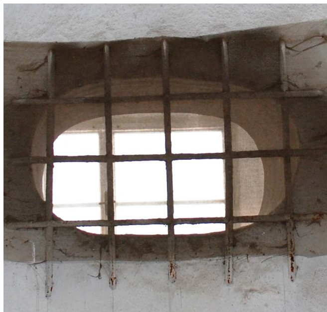
Pohled z místnosti 1.06 110127 hl 203