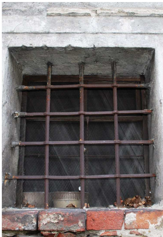
Pohled z exteriéru 110210 hl 203