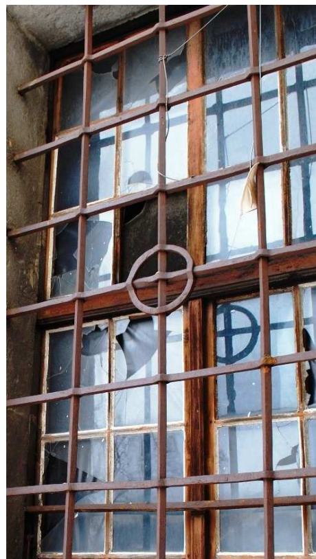
Detail 110127 hl 124